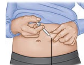
Pellizcar e inyectar